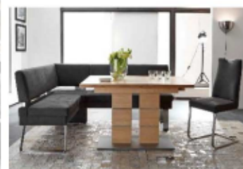
Tisch 5056 2B Wildeiche lackiert

VME -Zuteilung >Tisch 7823 6E in Lack weiß Nachbildung!!