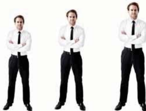
S bis ca. 165 cm M von ca. 165 bis 183 cm L ab ca. 183 cm

Der Sessel ist in jeder Ausführung in den 3 Größen S, M, L erhältlich. Alle relevanten Komfortgrößen (Sitzhöhe, Sitztiefe, Fußklappenlänge, Rückenhöhe) wachsen im Verhältnis mit, angepasst an alle Körpermaße.