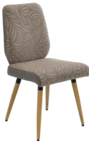
1A Stuhl mit Schemelfuß massiv in Asteiche natur mit Hülse oben in Metall schwarz Struktur